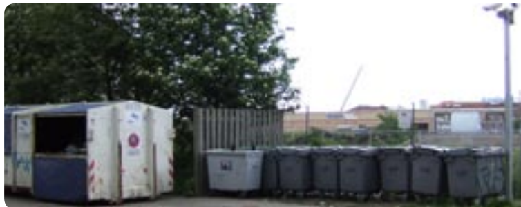
Det udendørs container område.

Desuden er der installeret 2 kameraer i det udendørs container område. Her har der nemlig været store problemer med, at folk kom og læssede deres affald af – specielt de mange butikker på Nørrebrogade. Men kamerarør gør nu, at ingen kan komme hverken ind eller ud af området uden at blive filmet og derved opdaget. Det er kun sket få gange, efter at kameraerne er blevet installeret, og billedmaterialet er videregivet til politiet.