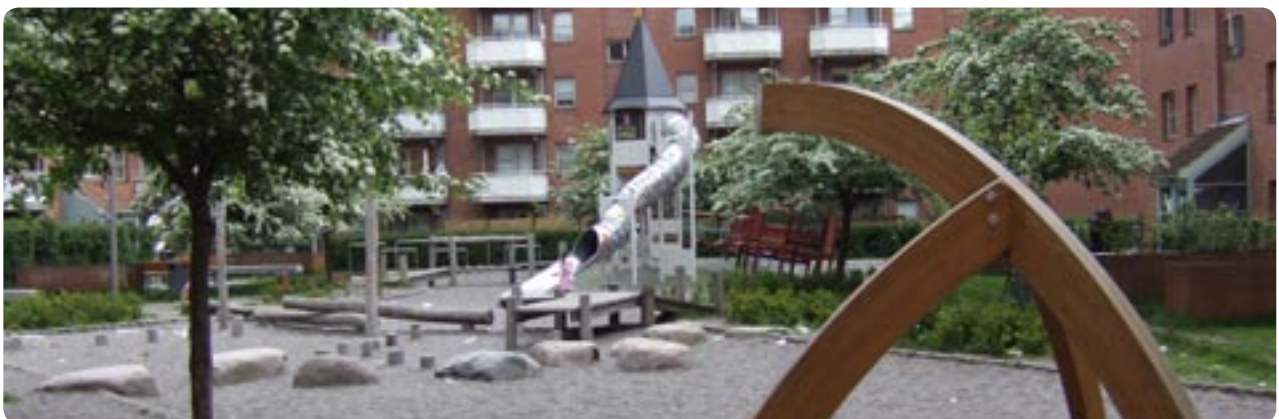
En af de i alt 4 gårdhaver der netop er blevet renoveret.

Løsningen har opfyldt forsikringsselskabets strenge krav samtidig med, at det har givet beboerne trygheden tilbage. Der er ikke længere adgang for hvem som helst til hverken opgange eller kælderarealer. Systemet har resulteret i, at alle de påsatte brande er ophørt, og antallet af hærværksaktioner er faldet drastisk.