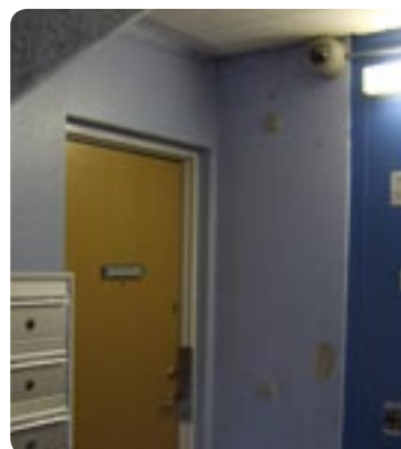
Der er opsat kamera ved postkasserne.