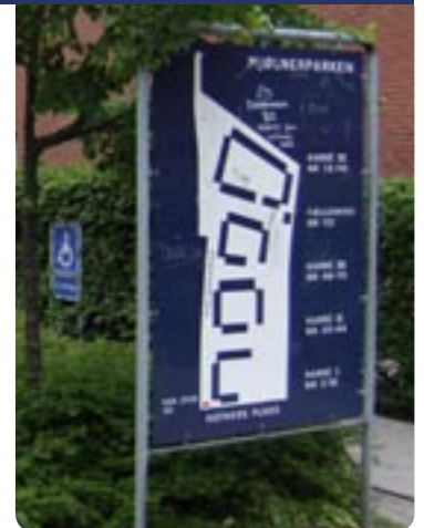
Indkørsel til Mjølnerparken.